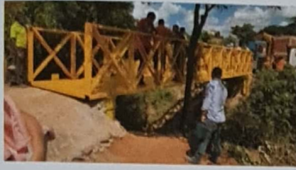
Instalação de ponte na Chácara 94, entre os Trechos I e II do Sol Nascente