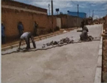
Instalação de blocos intertravados no Condomínio Pinheiros, Trecho II