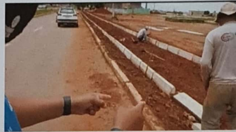
Construção de calçadas na Avenida P1 do Sol Nascente