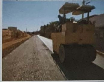
Pavimentação asfáltica nos Cond. Embaré e São João, nas margens da VC 311, Trecho II